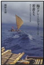
海のグレートジャーニーと 若者たち (武蔵野美術大学出版局)

2/23 から開催中の美術展『本と美術の展覧会 vol.5 あふれる、うごめく、のめりこむ。ー絵本原画とアートの空間ー』にあわせて図書館企画コーナーでは、絵本作家3名評論家1名のおすすめ本と著書を紹介しています。