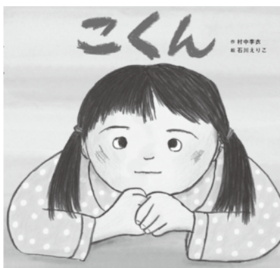
『こくん』 村中季衣作 石川えり絵 童心社 2019