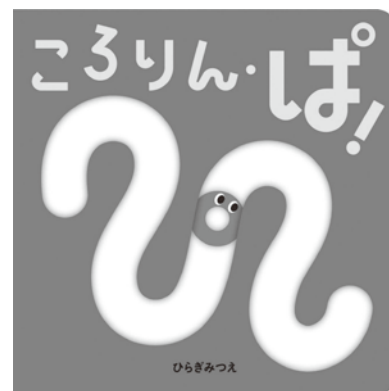
『ころりん・ぱ!』 ひらぎみつえ作 ほるぷ出版 2019