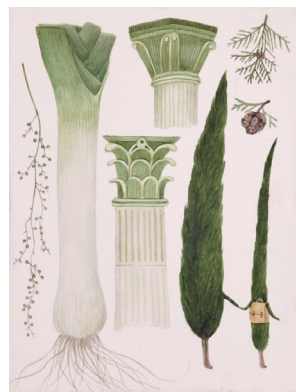
フェリドゥン・オラル(トルコ) 「見たままのまま?」