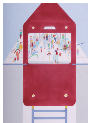
カロリーナ・セラージュ(ポルトガル) 「水平線」