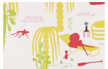
フレート・フィヴァッツ(スイス)「最高さん」