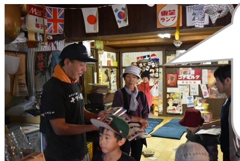
おもひで横丁 なつかし屋