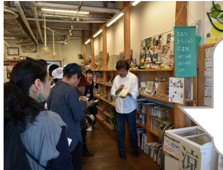
エールクリエイティブ