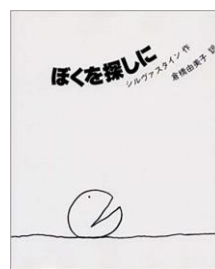
『僕を探しに』 シェル・シルヴァスタイン作