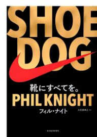
『SHOE DOG』 フィル・ナイト 著

今回皆さんにたく さんの本を紹介して いただきました。ご協 力いただき、誠にあり がとうございました